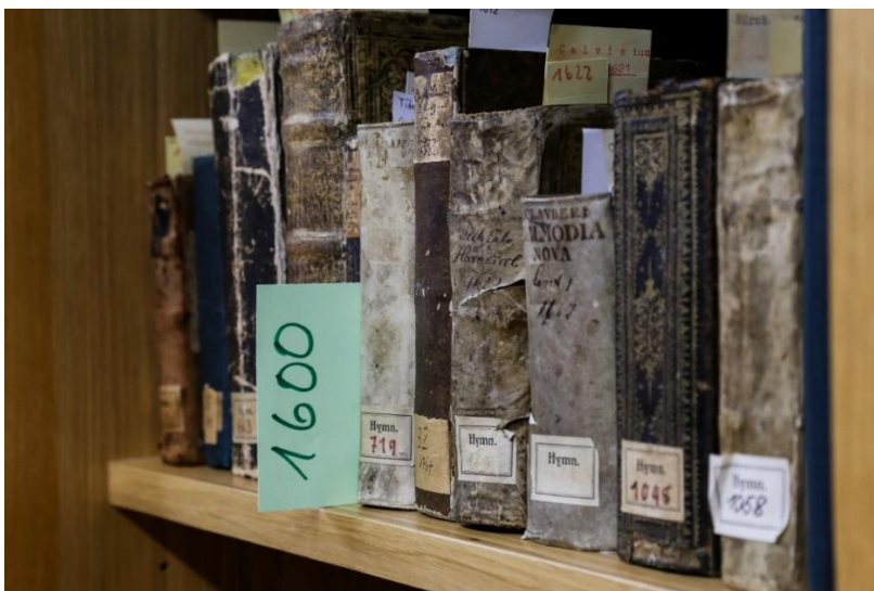
Gesangbücher des Hannoverschen GBA, Foto: Michaeliskloster, Jonas Kretschmann

Enthält über 2600 originale Gesangbücher aus der Zeit des 16. Jahrhunderts bis heute aus dem gesamten deutschsprachigen Gebiet und darüber hinaus Signaturgruppe „gba*“